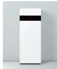
Vitodens 222-F Typ B2SF