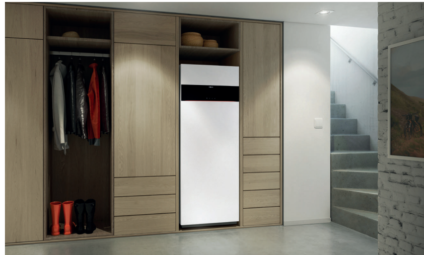
Vitodens 222-F mit attraktivem Design in der Farbe Vitoppearlwhite