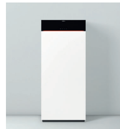
Vitodens 222-F Typ B2TF