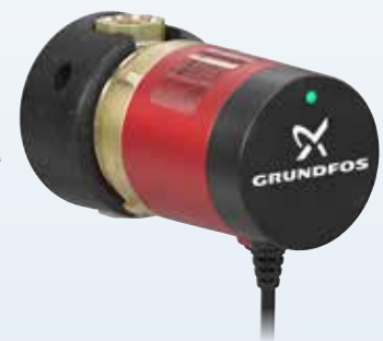
COMFORT B PM 1-STUFIG