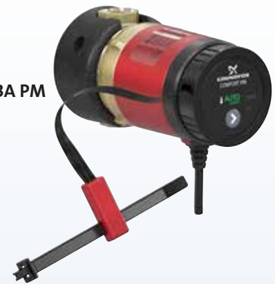
COMFORT BA PM AUTOADAPT