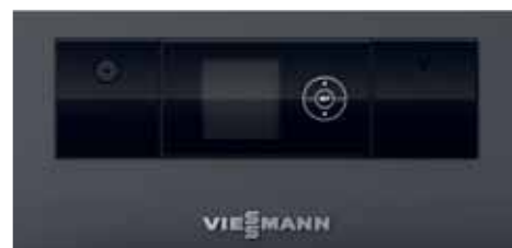
Regelung Ecotronic 100 mit beleuchtetem Display für einfache und intuitive Bedienung

Die Heizflächen lassen sich seitlich mittels Hebel komfortabel reinigen. Aufgrund der Vergasertechnik und Verbrennungsregelung mit Lambdasonde erreicht der Vitoligno 150-S einen hohen Wirkungsgrad und eine saubere, effiziente Verbrennung mit sehr niedrigen Staubwerten. Der beidseitige Türanschlag ermöglicht eine optimale Raumnutzung und Eckwandaufstellung im Aufstellraum.