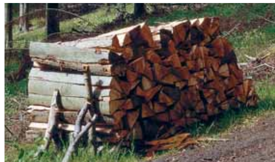
Heizen mit Holz – der natürlichste Brennstoff der Welt

Der Vitoligno 150-S arbeitet modulierend und passt sich stufenlos dem momentanen Wärmebedarf an. Die Verbrennungsregelung mit Lambdasonde und Abgastemperatursensor erfasst den Sauerstoffgehalt und die Temperatur der Abgase. Sie sorgt für niedrige Emissionen und einen hohen Wirkungsgrad von bis zu 93,1 Prozent. So verwandelt der Vitoligno 150-S das Scheitholz sparsam in nutzbare Wärme.