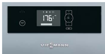
Regelung Ecotronic 100 mit beleuchtetem Display für einfache und intuitive Bedienung

Der kompakte Scheitholzessel ist auch eine hervorragende Wärmeergänzung von bestehenden Öl- oder Gas-Heizungsanlagen. Dann übernimmt er im bivalenten Betrieb die Grundversorgung mit Heizwärme und Warmwasser. Erst bei extrem niedrigen Temperaturen wird der konventionelle Heizkessel zur Abdeckung der benötigten Spitzenlast zugeschaltet.