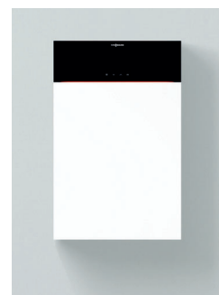
Vitodens 200-W Typen B2HF/B2KF

Komfortable Bedienung auf Augenhöhe durch nach oben versetzbares Display