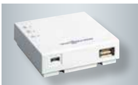
Vitoconnect mit Anschlüssen für das Steckernetzteil (links) und zur Datenverbindung