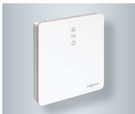
Anlagenaufschaltung mit Vitoconnect

Der Heizungsbauer erhält nach Freischaltung durch den Anwender die Erlaubnis für ein kontinuierliches Anlagenmonitoring, bei dem er eventuelle Störungen frühzeitig erkennen und vorbeugend reagieren kann.