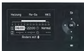
Neue Vitotronic Regelung – klare Anzeige der Schaltzeiten