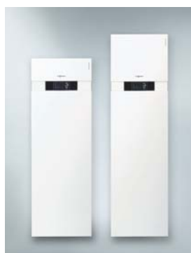
Vitocal 333-G (links) Vitocal 343-G (rechts)