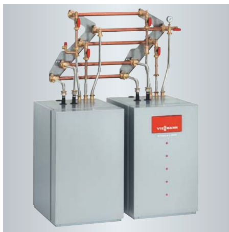
Zweistufige Wärmepumpe Vitocal 300-G (Master/Slave) – für die hydraulische Kopplung der Wärmepumpen-Module untereinander steht ein Verrohrungs-Set mit Armaturen und Absperrhähnen zur Verfügung. Die regelungstechnische Verbindung wird über steckerfertige Leitungen hergestellt.