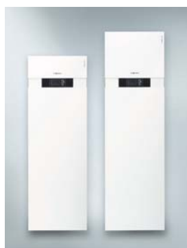
Vitocal 222-G (links) Vitocal 242-G (rechts)