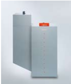
Vitoligno 300-P 4 bis 24 kW