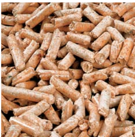
Pellets sind der ideale Brennstoff: zukunftssicher, preisgünstig, einfach zu lagern und CO 2 -neutral